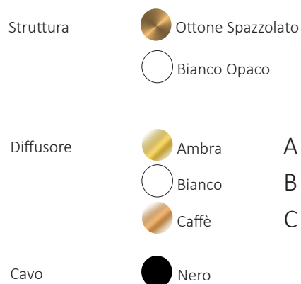
TAVOLA FINITURE :